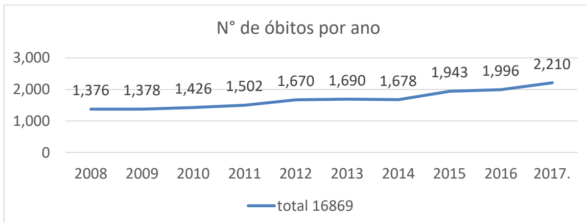
Gráfico 1: Número de óbitos por lesão autoprovocada intencionalmente em idosos no Brasil entre 2008 a 2017.